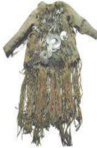
Şekil 2. Yakut Şaman elbisesi (Gürcan, 2018).

Erlik'in yarattığı haşere ve zararlı hayvanlarla şamanlar bu kara güçlerle savaşmak için manyaklarına (üste giyilen pardösü gibi, bakırdan veya demirden nesnelere kaplı kıyafet) hem davullarına bu haşeratların resimlerini çizerek törende kullanıp hastalık saçmalarını engellemeye çalışırlardı (Bayat, 2019).