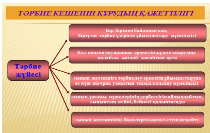
2-сурет. Тәрбие жүйесінің кешенділігі