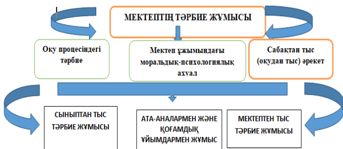
1-сурет. Мектептің тәрбие жұмысының құрылымы

Қазақ мектептеріндегі тәрбие жұмысы, аты айтып тұрғандай өзіндік ұлттық ерекшелігімен, жаңашылдығымен айшықталуы керек. Яғни, қазақ мектебіндегі оқу-тәрбие үдерісіндегі жаңашылдық: