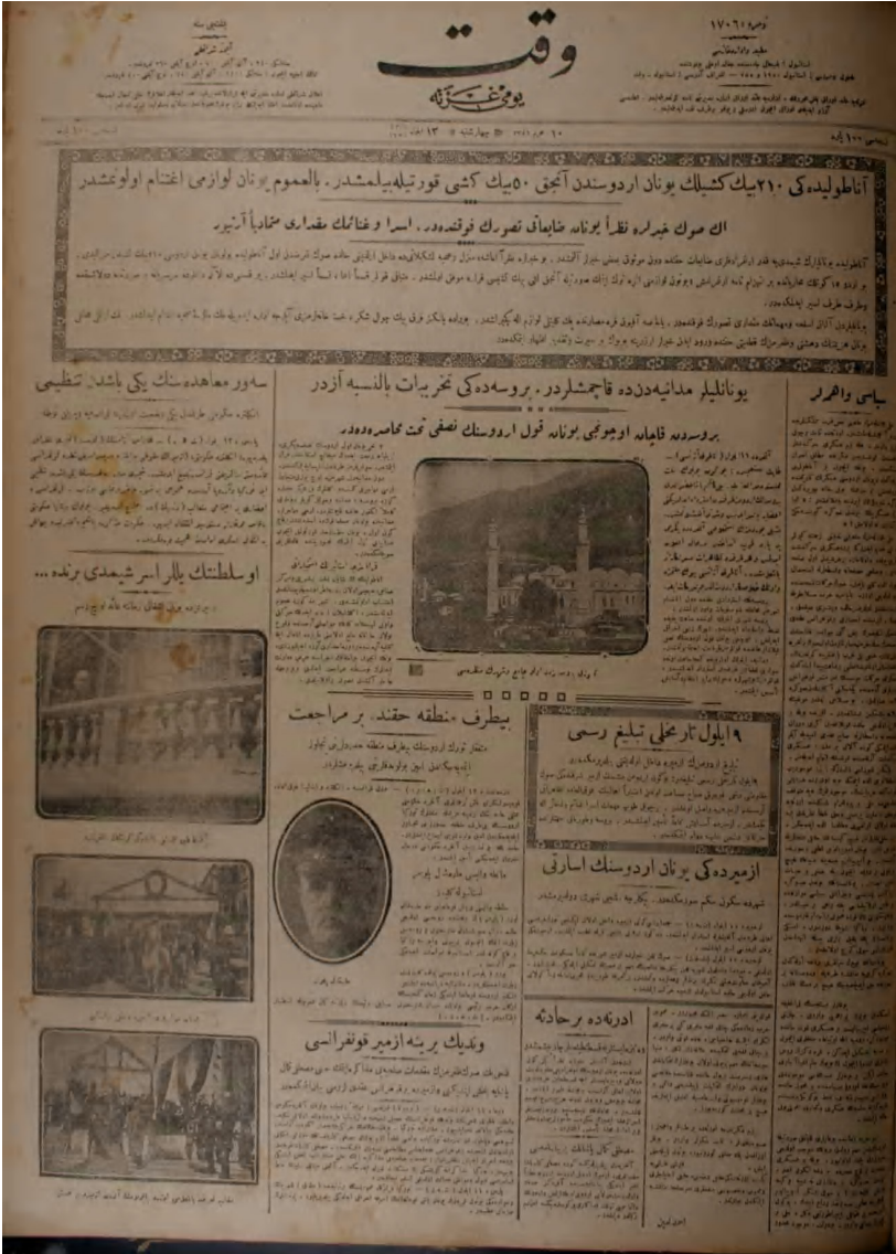
464 Bu gazete metninde “Yunanlılar Bursa’ dan Kaçmışlardır...” yazısından faydalanılmıştır.